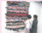
▲異様に横糸を通す受講者