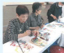
▲色の組み合わせを楽しんだ参加者