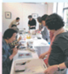
▲会期中、満員大盛況!