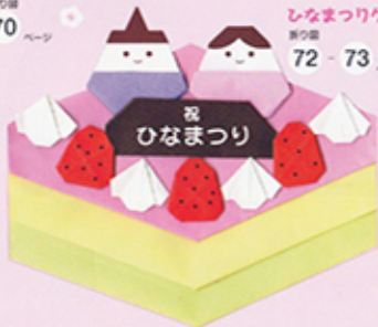
ひなまつりケーキ