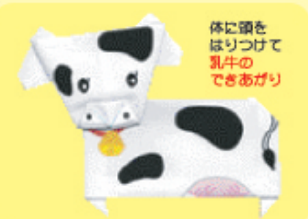
体にはりつけて乳牛のできあがり